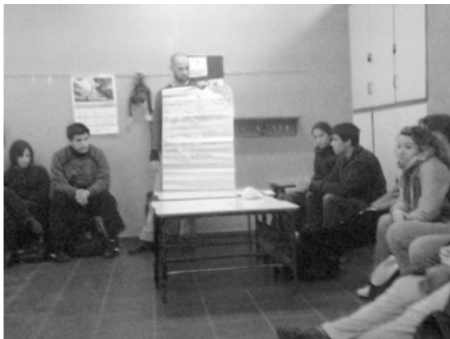
19 de agosto de 2011. Escuela 309.