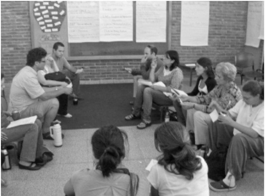
1º de marzo 2012. Escuela 375.